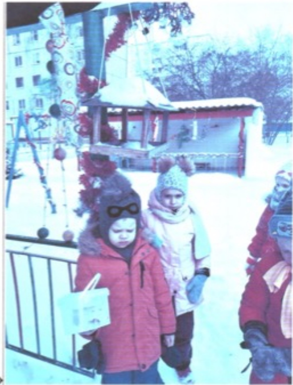
Отчет по акции «Помоги птицам»