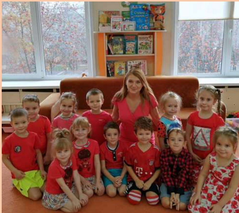
Рисунок 1 Цвет настроения красный

Заранее воспитателем с детьми обговаривается цвет, ему посвящается весь день. Помогают в этом родители. Цвет присутствует в оформлении группы, одежды, игрушках.