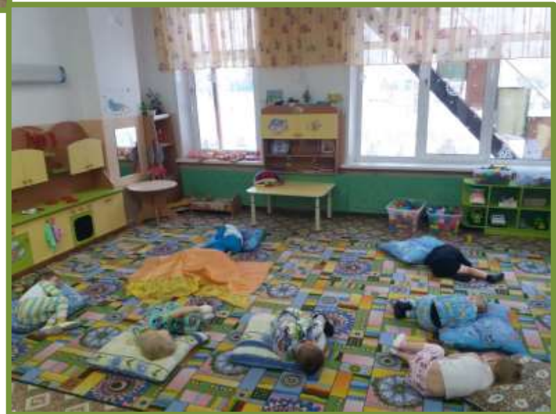
Игра «Сонные прятки»