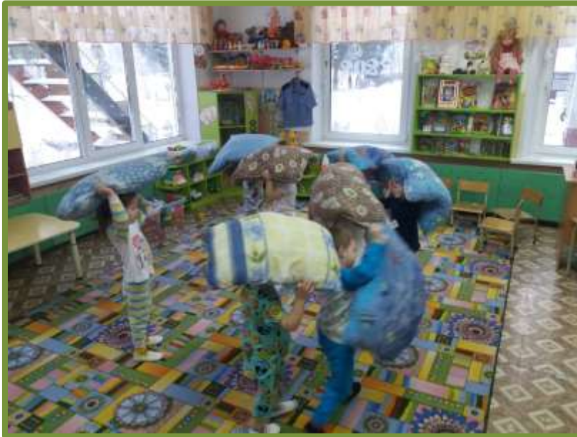
Игра «Пронеси подушку на голове»