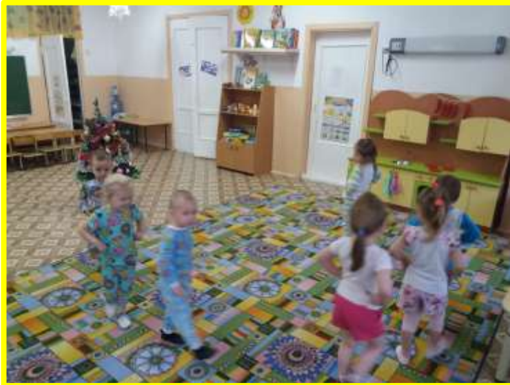
Игра «Показ мод»