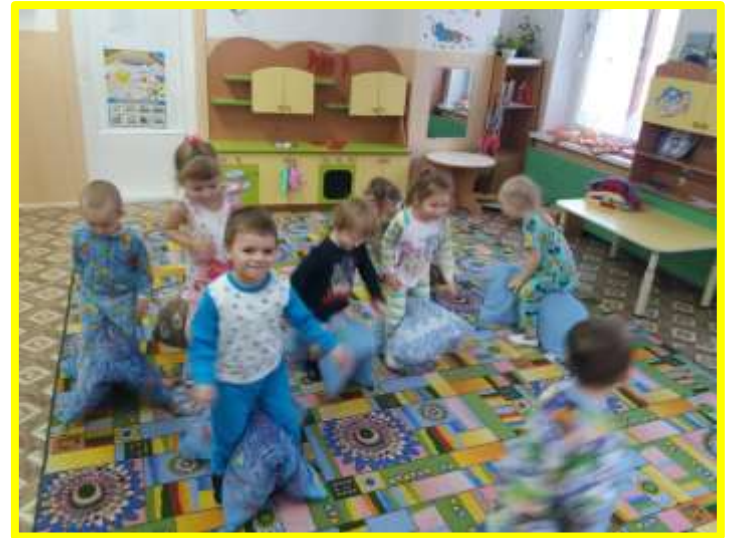
Игра «Прыжки с подушкой»